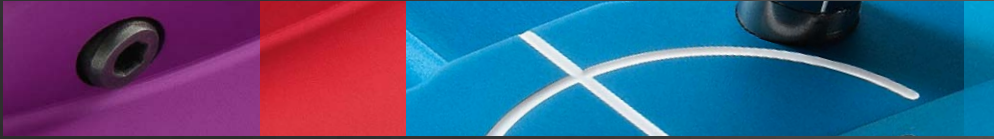
HPP 300 JUNIOR – THE NEXT GENERATION PUTTER