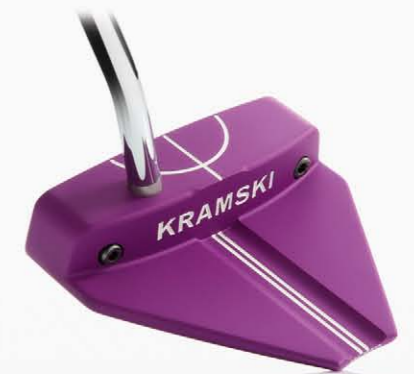
HPP 300 JUNIOR

The result is a putter that lets young players enjoy success on the golf course and is fun to use – because it helps them putt correctly, right from the start.